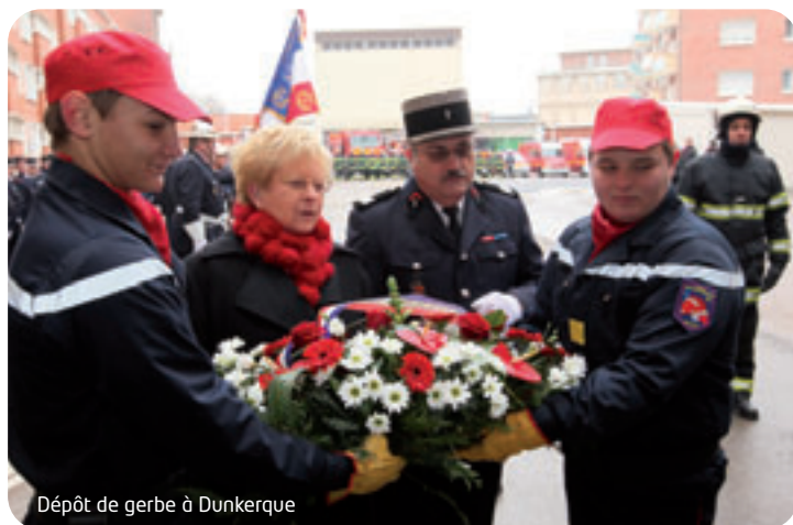
Dépôt de gerbe à Dunkerque

de la création d'une culture commune Sapeurs-Pompiers – Personnels Administratifs, Techniques et Spécialisés. Fin 2010, 277 des 527 PATS avaient été formés au PSC1 (Prévention et Secours Civiques de niveau 1) par les Sapeurs-Pompiers. Il a ponctué son discours en félicitant les sportifs s'étant distingués au cours de l'année tout en rappelant que « seule la pratique régulière d'une activité physique était réellement essentielle. » Avant que l'aspect festif ne reprenne ses droits, une remise de médailles a marqué chaque cérémonie.