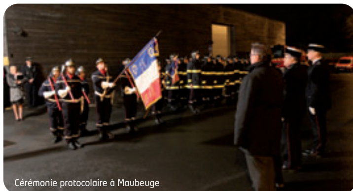
Cérémonie protocolaire à Maubeuge