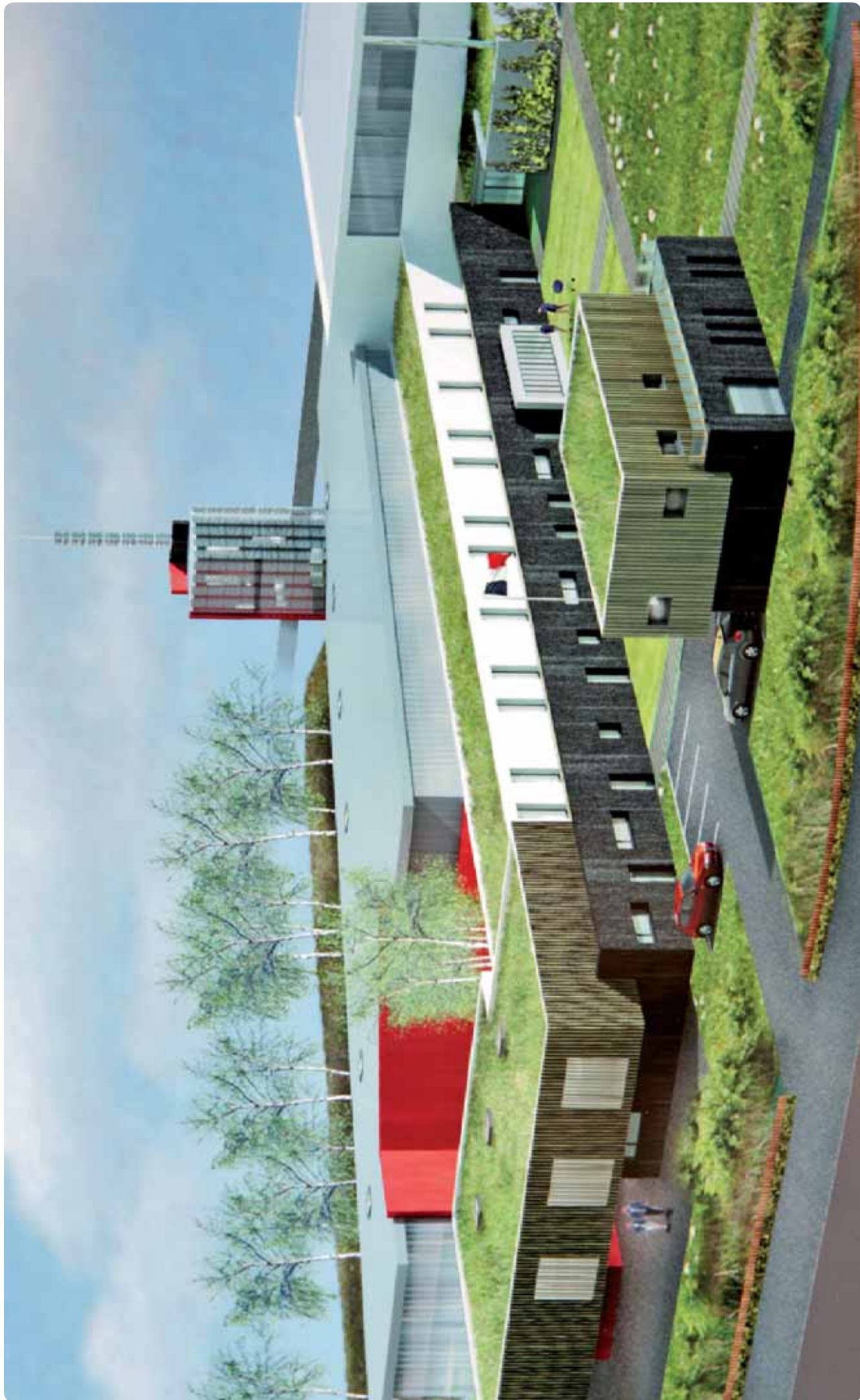
Présenté dans la précédente édition de la Lettre du SDIS, le nouveau CIS Vieux-Condé sera opérationnel au cours du second semestre 2010.